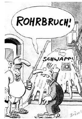
Mit freundlicher Genehmigung von "Werner" (Rötger Feldmann)

6. Der Alterungseffekt war gut bekannt und in die Konstruktion aufgenommen, aber statistische Effekte führen zu Ausreißern .