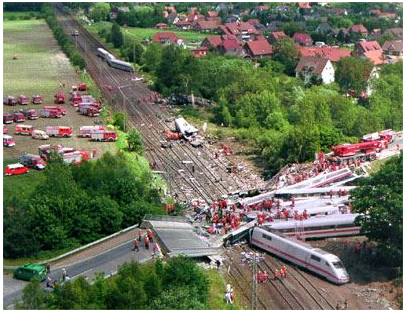
Die Folge eines gebrochenen Radreifens