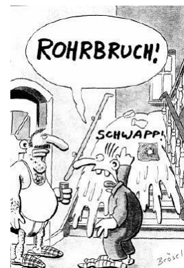
Mit freundlicher Genehmigung von "Werner" (Rötger Feldmann)

6. Der Alterungseffekt war gut bekannt und in die Konstruktion aufgenommen, aber statistische Effekte führen zu Ausreißern .